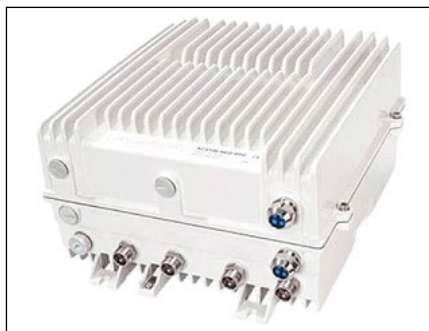
La solución Remote Phy de Network Broadcast