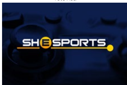
Shesports, el ciclo de Bitme dedicado a las chicas gamers