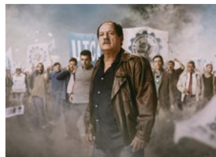
El Tigre Verón se emite por El Trece y Flow en Argentina

Por otra parte, TNT también anunció el inicio del rodaje de su nueva serie original producida por Dopamine, Amarres . La serie se estrenará en su pantalla el segundo trimestre de 2020. Rodada en la Ciudad de México, este dramedy está dirigido a toda la familia con un reparto encabezado por Gabriela de la Garza, Juan Pablo Medina y Hugo Catalán.